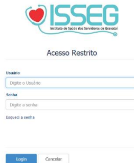
Figura 1 - Interface de acesso ao sistema do Credenciado

Assim que acessar o sistema, será solicitado o usuário e senha de acesso, conforme apresenta a figura 1. O usuário e senha serão gerados pelo ISSEG e encaminhados por e-mail para cada um dos credenciados.