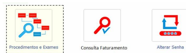
Figura 2 - Funções disponíveis ao credenciado

Após o acesso será possível executar 3 ações diferentes junto ao sistema. A primeira, está relacionada a geração de lançamentos de procedimentos e exames realizados pelo credenciado ("Procedimentos e Exames"). A segunda, lista a relação de fechamentos mensais junto ao ISSEG, que foram encaminhados para pagamento ("Consulta faturamento") e a terceira a última ação está relacionada a troca de senha de acesso ao sistema ("Alterar Senha"). A figura 2, apresenta as opções da interface após acessar a área do credenciado.