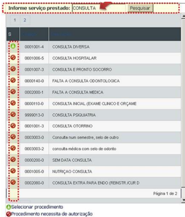
Figura 6 - Busca por procedimento

Rua: Adolfo Inácio Barcelos, 783, salas 301, 401 – Gravataí/RS - CEP: 94010-200 -Fone: (051) 3191 5037