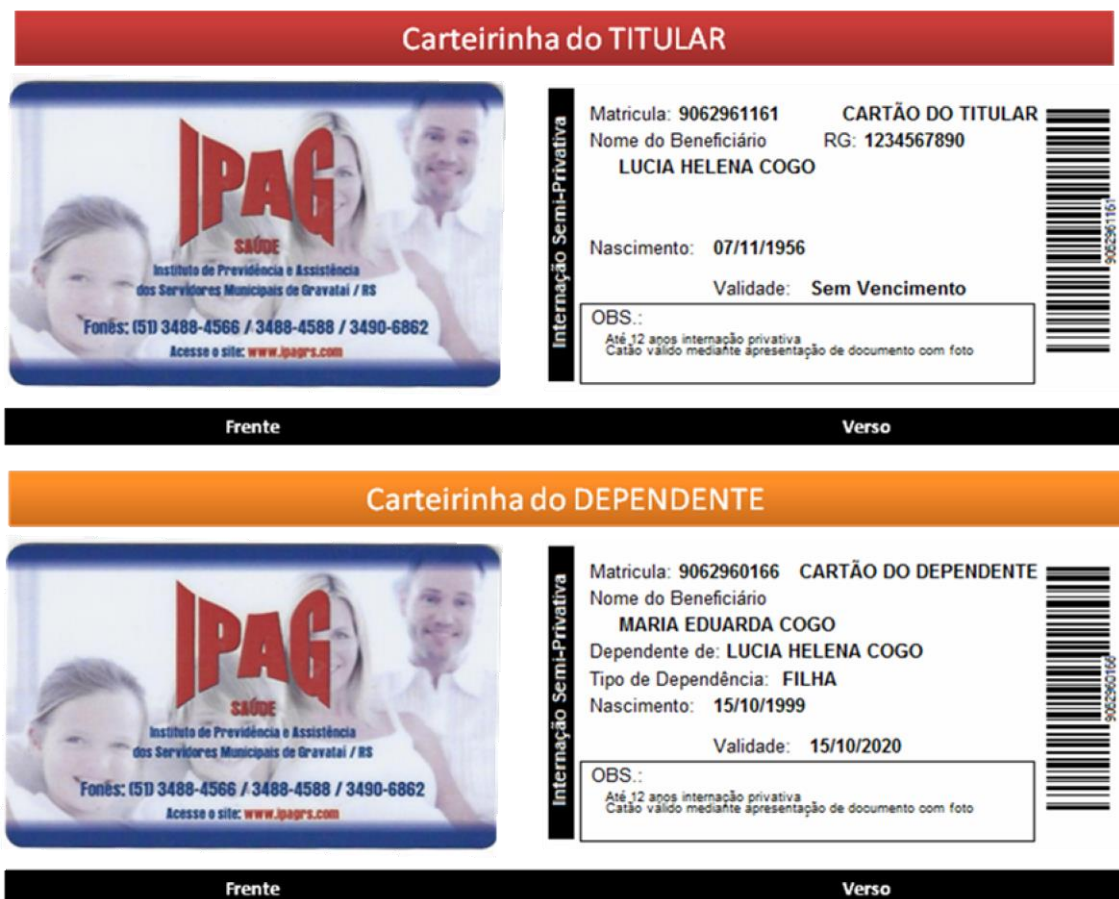
Figura 8- cartão ISSEG

Na figura 8, apresentamos o novo cartão ISSEG em substituição das carteiras de papel. O cartão ISSEG será distribuído aos segurados a partir de 29 de dezembro de 2014 até junho de 2015. Neste período, ambos terão validade cartão e/ou carteira de papel. A partir de 01 de julho de 2015, somente os cartões deverão ser aceitos.